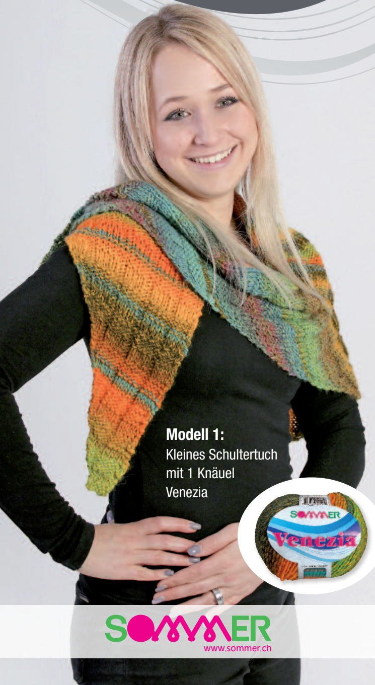
Modell 1: Kleines Schultertuch mit 1 Knäuel Venezia